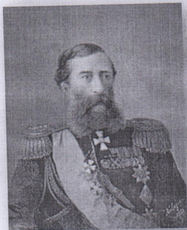
Михаил Лорис-Меликов (1824-1888)